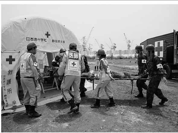
救護所への患者搬送の様子

訓練には、自治体や消防など防災関連機関51団体や地域住民約1万5千人が参加し、当院からも医師・看護師・薬剤師・事務の10名で編成した救護班が派遣されました。