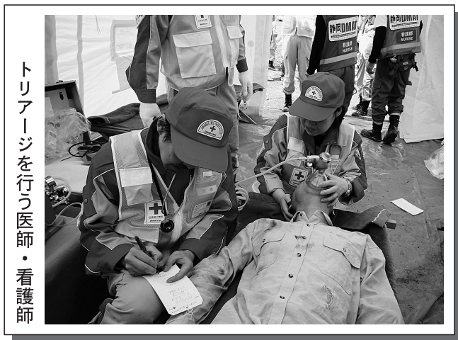
トリアージを行う医師・看護師

訓練は御前崎沖20キロ付近の駿河湾でマグニチュード8.0の地震が発生し、住民が湾内に流されたという想定で行われました。救護員は医療活動を行うため、救護所の設置や患者の搬送、また、トリアージと呼ばれる重症度で被災者を振り分け、緊急性の高い傷病者から対応するための初期判断を医師や看護師が中心となり行いました。