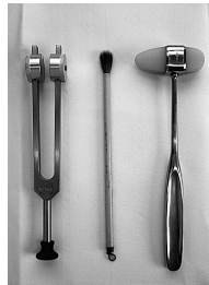
写真1 神経学診断の道具

形外科では必ずしも学問と言えないような診断・治療が行われてきました。それが迷信を生み今なお患者さんを路頭に迷わせている最大の原因と言えます。世界的に有名な雑誌「SPINE(せぼね)」ですら、数を集めて統計学的有意差を出した論文が優先的に採用されるのが実情です。そもそも臨床医学のほとんどが統計学の力を借りずには科学として成り立ちません。しかしながらわれわれが日々直面する症例のひとつひとつの積み重ねは、例え少数であっても数千例以上の重みを持っています。腰痛の真実を教えてくださいるのは教科書でも文献でもなく、他ならぬ患者さんそのものだと思います。思いながら日々診療にあたっています。