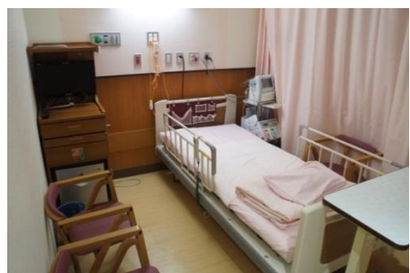
陣痛室4ベットあります