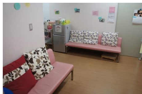
スタッフが毎日、授乳の指導や育児の相談にのっています