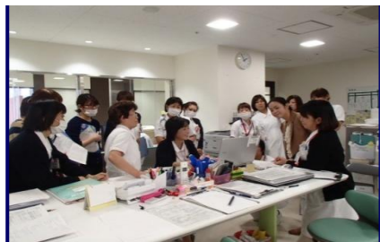
外泊支援を実施した病棟との合同カンファレンス

“今しかない”家に帰りましょう！ そんな患者・家族の支援が増えています また、訪問看護の相談は医師・外来看護師・病棟看護師・看護助手・ ケースワーカー・ケアマネジャーなど多岐に渡っています お気軽に訪問看護師に連絡をしてくださいね 待っています