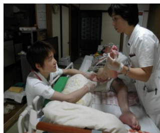
在宅において皮膚排泄認定看護師との連携