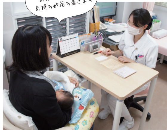
終始、和やかな雰囲気で行われます