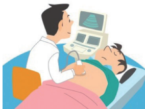
図2) 腹部大動脈瘤のリスク因子

とはいうものの、最も大事なことは早い段階で大動脈瘤の存在を知ること。健診や人間ドックなどで定期的に腹部超音波検査を行っている方は、ぜひ積極的なスクリーニング検査をお勧めします。