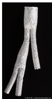
腸骨動脈血流温存 ステンドグラフト

A ステンドグラフトとは化学繊維でできた人工血管で、内部にバネ状の骨格構造を備えています。医療技術は日に日に進化していて、例えば最新のステントグラフト(右図)では骨盤に血液を送る腸骨動脈の血流を温存でき、合併症の発生を低減できるようになっています。ステンドグラフトを使った治療は手術時間が短く、入院も短くてすむなどの長所がありますが、解剖学的な制限があるため全ての患者さんに適用できる訳ではありません。また動脈瘤自体を切除しないため、遠隔期に追加治療が必要となることも。