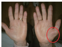
上/手根管部のMRI画像 下/右手の母指球筋がやせた状態。左右の手のひらを比べると違いがよくわかる

塗布薬、運動の軽減など保存療法が中心。靭炎の場合は腱鞘内に注射を行ったり、夜間痛が強ければ就寝中のみシーネ固定することで痛みが改善することも。症状が進んで母指球筋がやせてきた場合や腫瘍がある場合は手術が必要。手のひらを3〜4cm切開し、直視下で横手根靭帯を切開して神経の圧迫を除去、母指球筋がやせている場合は筋肉を動かす信号を送る神経の圧迫も除去します。術後は数日固定が必要ですが特別なリハビリは必要ありません。